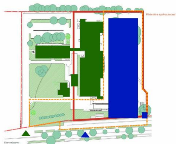
PHASE 1b : CONSTRUCTION BÂTIMENT NEUF - ETE 2022 - PRINTEMPS 2024